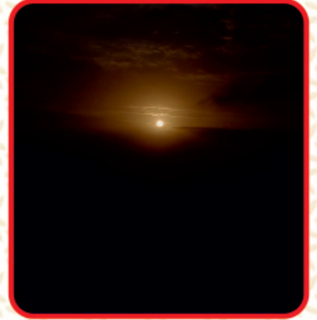
आंबोली सनसेट पॉईंट