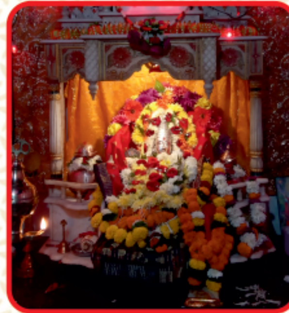
माऊली मंदिर, गावठणवाडी