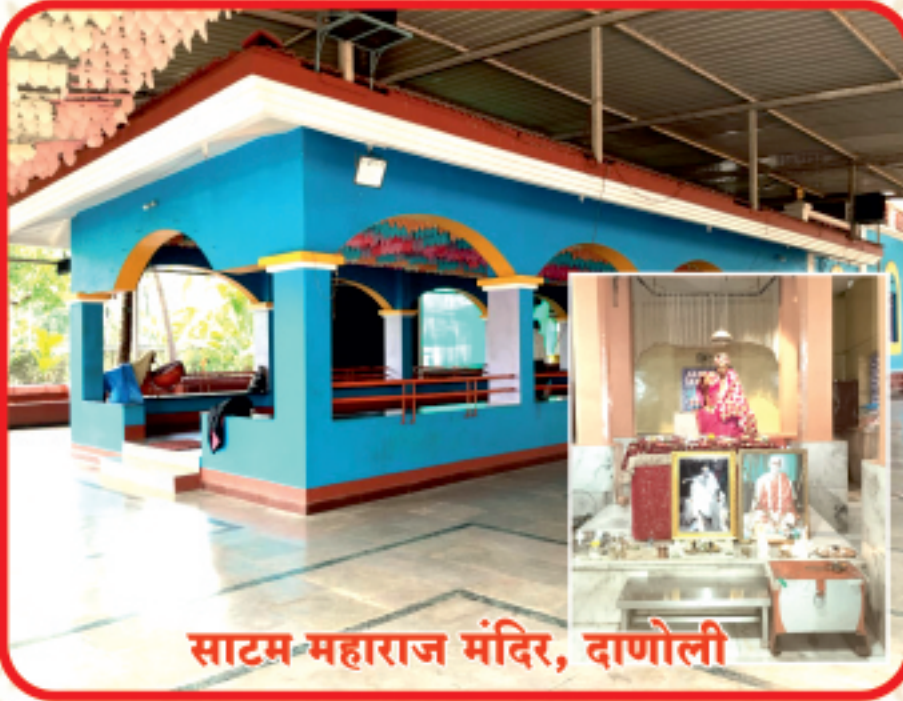
साटम महाराज मंदिर, दाणोली