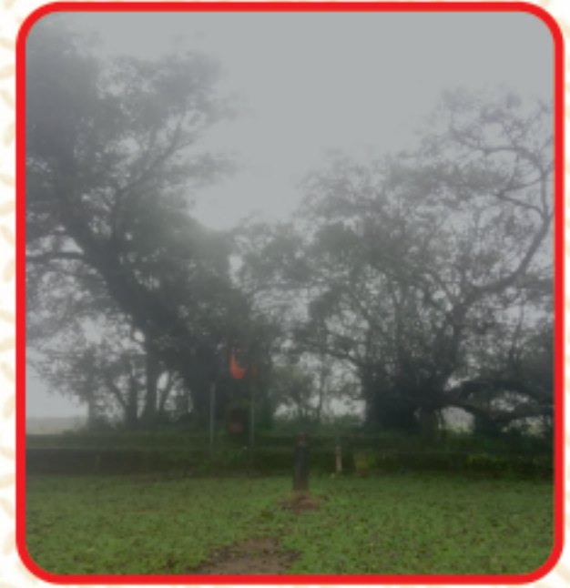
गाव चव्हाटा मंदिर