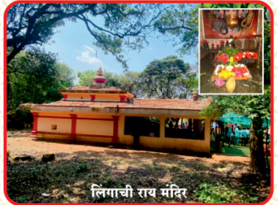
लिंगाची राय मंदिर

जैवविविधतेने परिपूर्ण असा आंबोलीतील पुरातन आणि आध्यात्मकाची अनुभूति देणारा "लिंगदेव राई" असा परिसर आहे. येथे पुरातन महादेवांचे मंदिर असून शिवलिंग, नंदी, श्री गणेश आदी विराजमान आहेत. श्री देवी भावई, श्री देवी सातेरी यांचीही बाजूलाच मंदिरे आहेत. तसेच इतरही देवांची मंदिरे ह्या परिसरात आहेत. हे मंदिर जागृत मंदिर असल्याने दर सोमवारी, श्रावण महीना, महाशिवरात्रि तसेच इतर सनात भाविकांची मोठी गर्दी पाहायला मिळते. तर आंबोलीतील ह्या श्री लिंगदेव राई मध्ये वनौषधींचा जणू खजानाच सापडतो. सोबत दुर्मिळ व अतिदुर्मिळ वन्यजीव यांचाही वास आढळून येतो. असे हे ठिकाण आहे.