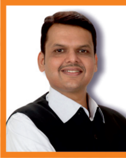
मा. देवेन्द्र फडणवीस उपमुख्यमंत्री, महाराष्ट्र राज्य