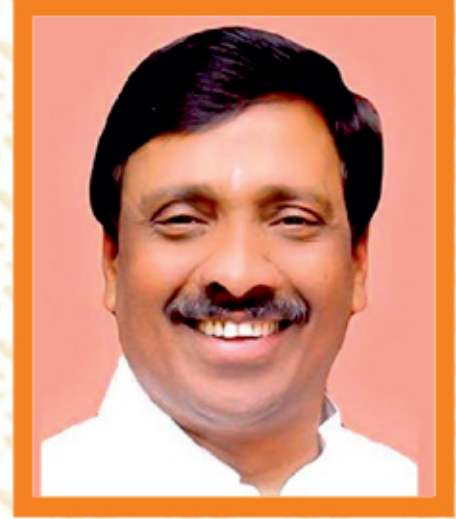
मा. विनायक राजूत खासदार, सिंधुदुर्ग