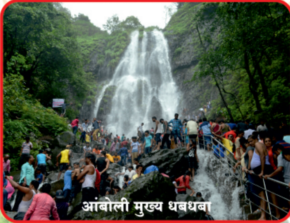
आंबोली मुख्य धबधबा

आंबोली घाटातील वैशिष्टपूर्ण आणि रोमांचित करणारा असा आंबोली मुख्य धबधबा आहे. हाच धबधबा आंबोलीचे अस्तित्व देखील आहे. दरवर्षी मॉनसूनच्या आगमना नंतर पावसाळ्यात आंबोली मुख्य धबधबा प्रवाहीत झाल्यावरच आंबोली वर्षा पर्यटनाला खऱ्या अर्थाने सुरुवात होते. त्यानंतर लाखो पर्यटक ह्या आंबोली धबधब्याला भेट देतात. या धबधब्याची क्रेझ लहान-थोरांसह सर्वांनाच असते. तर आंबोली धबधबा एकमेव सुरक्षित समजला जाणारा धबधबा अशी ओळख आहे. हा धबधबा पावसाळ्यात पाहणे देखील डोळ्यांचे जणू पारणे फेडणारे असते. तर आंबोली मुख्य धबधबा हा उंच डोंगर कड्यावरून पांढऱ्याशुभ्र असा फेसाळत कोसळतो. तर ह्या धबधब्यावर भिजण्यासाठी जाण्याकरिता पायऱ्या आहेत. पावसाळ्यात दरदिवशी हजारो पर्यटक या धबधब्याला भेट देतात. तर सुट्टी दिवशी लाखो पर्यटक एकाच वेळी येथे गर्दी करतात. आणि आंबोली वर्षा पर्यटनाचा मनमुराद आनंद हे पर्यटक घेतात.