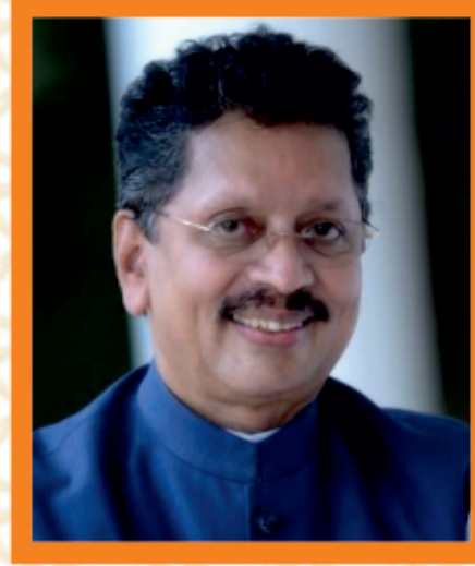
मा. दिपक केसरकर

सार्व. बांधकाम मंत्री तथा पालकमंत्री, सिंधुदुर्ग