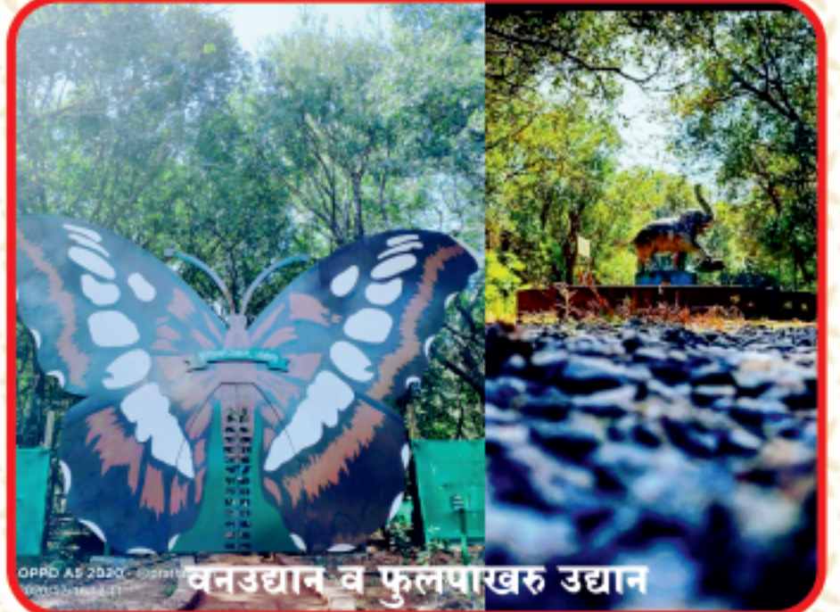
वनउद्यान व फूलपाखरू उद्यान

आंबोली वनउद्यान हे मुख्य रस्त्या पासून ३०० मीटरवर असून येथे पूर्वी जंगली प्राणी पिंजऱ्यात ठेवण्यात आलेले होते. मात्र, आता येथे जंगली प्राणी नसून एक वनौषधीने भरलेले वनउद्यान असून येथे जैवविविधता पाहता येते. पावसाळ्यात नेचर कॅम्पस करिता हे पार्क दुर्मिळ खजानाच असतो. दुर्मिळ ते अतिदुर्मिळ तसेच नव नवीन उभयचर, जलचर यांचा वावर येथे सहज आढळून येतो. त्यामुळे निसर्गप्रेमी पर्यटक, अभ्यासक तसेच फोटोग्राफी करिता असंख्य पर्यटक येथे भेट देतात. तसेच याच उद्यानात प्रथमच बटरफ्लाय गार्डन उभारण्यात आलेले असून फूलपाखरू प्रेमींसाठी ही एक पर्वणीच आहे.