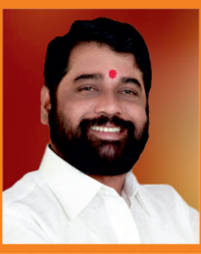
मा. एकनाथ शिंदे मुख्यमंत्री, महाराष्ट्र राज्य