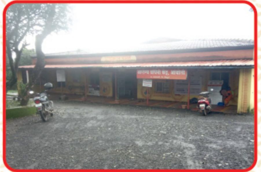
आंबोली प्राथमिक आरोग्य केंद्र