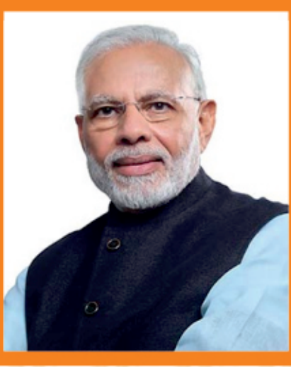
मा. नरेंद्र मोदी पंतप्रधान