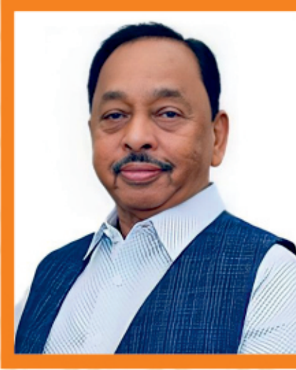
मा. नारायण राणे खासदार, केंद्रिय मंत्री