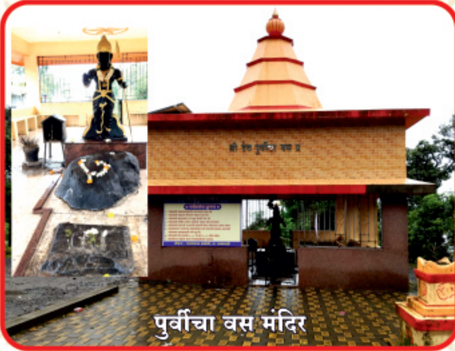
पूर्वीचा वस मंदिर

पूर्वीचा वस मंदिरांबोली घाटातील महत्वाचे असे हे जागृत देवस्थान आहे. घाटमार्ग बांधण्याआधी येथूनच पायवाटेने पारपोली मार्गे प्रवास केला जात असे. हे जुने आणि ऐतिहासिक असे स्थान आहे. घाटमार्गातून प्रवास करणारे प्रवासी, वाहन चालक व पर्यटक नेहमी दर्शन घेत पुढील प्रवास करतात. तर याच परिसरात आंबोली सनसेट पॉइंट देखील असून सूर्यास्त दर्शन येथून केले जाते.