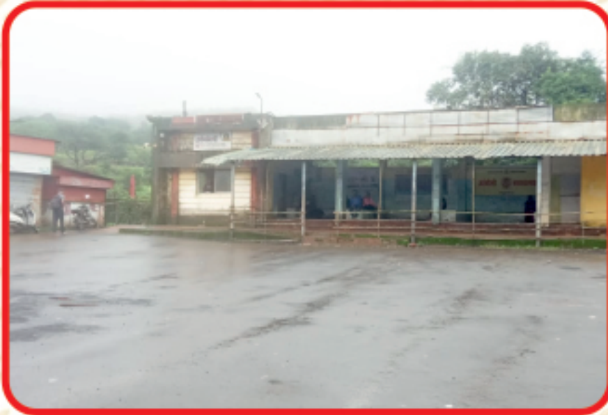
आंबोली मुख्य बस स्टॉप