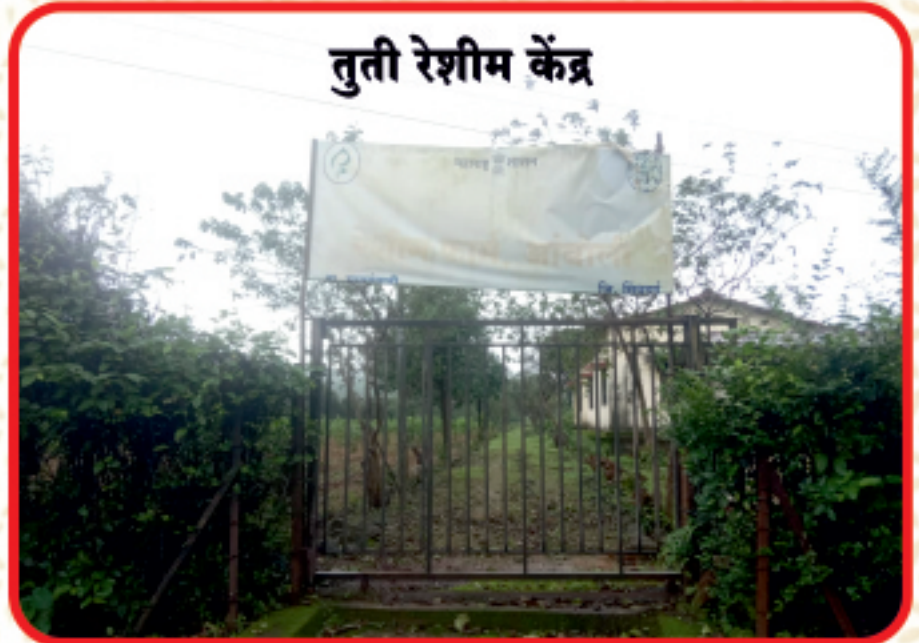
तुती रेशीम केंद्र

आंबोली व सुळेरान या ठिकाणी तुतीरेशीम पैदास केंद्र आहे. हे महाराष्ट्र शासनाचे उद्योग आहे. आंबोलीमध्ये अंडी पूज निर्मिती केंद्र आहे. रेशीमसाठी जी अंडी लागतात ती या ठिकाणी तयार केली जातात व महाराष्ट्र - कर्नाटकात शेतकऱ्यांना दिली जातात. आंबोली व सुळेरान या ठिकाणी बरीच तुती लागवड आहे. या ठिकाणी कोष पण तयार करतात ग्रीनीज, रेरींग, फिडींग असे त्यांचे प्रोसेस आहे. मुख्य प्रोसेस म्हणजे अंडी तयार करणे. तयार केलेले कोष बेंगलोर - नागपूरला पाठवितात,