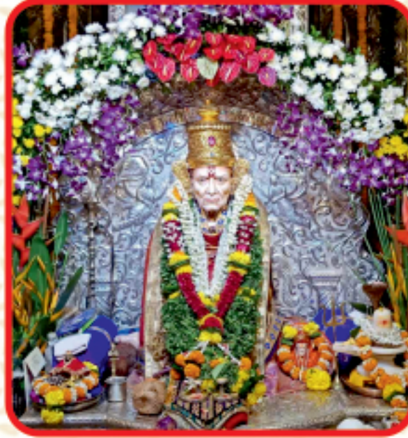
श्री स्वामी समर्थ मठ