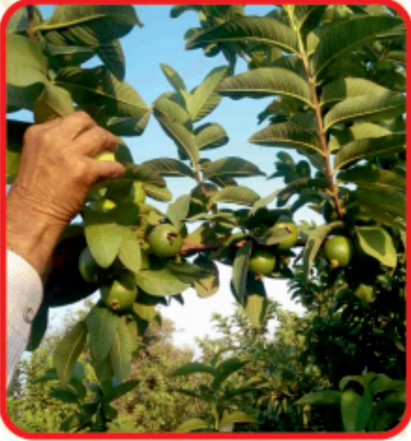
मेनन कंपनी पेरुची बाग (गडदुवाडी)