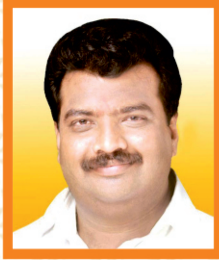
मा. रविंद्र चव्हाण

सार्व. बांधकाम मंत्री तथा पालकमंत्री, सिंधुदुर्ग