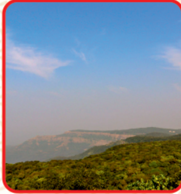
आंबोली व्ह्यु पॉईंट