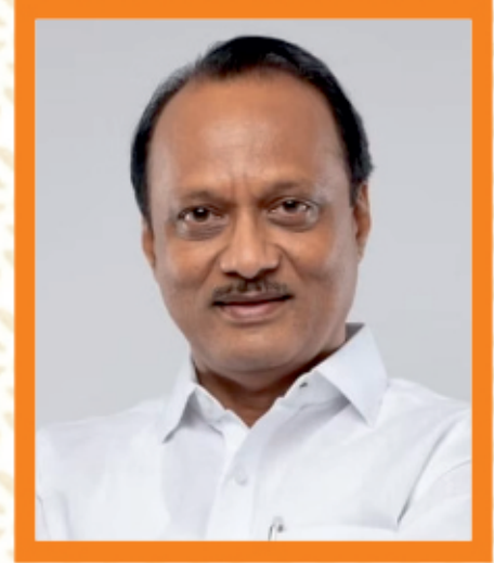
मा. अजित पवार उपमुख्यमंत्री, महाराष्ट्र राज्य