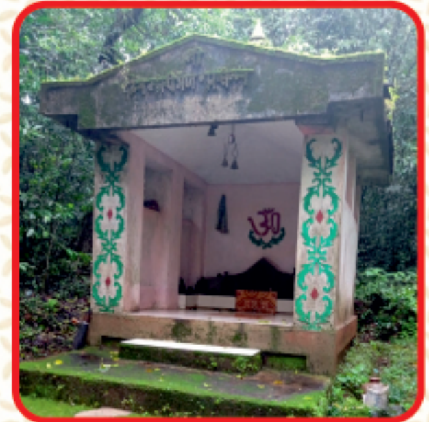
महारवस (दांडेकर मंदिर)